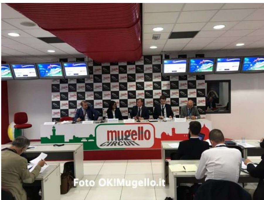
Un momento del Convegno dell'Assosistema-Confindustria al Mugello Circuit

Poi la classica ciliegina sulla torta con un buffet offerto a tutti i partecipanti, curato e servito con professionalità e signorilità dagli allievi del settore alberghiero dell'Istituto Professionale “Chino Chini” di Borgo San Lorenzo. Come tradizione ecco alcune immagini di questa due giorni nel Mugello. (Aldo Giovannini)