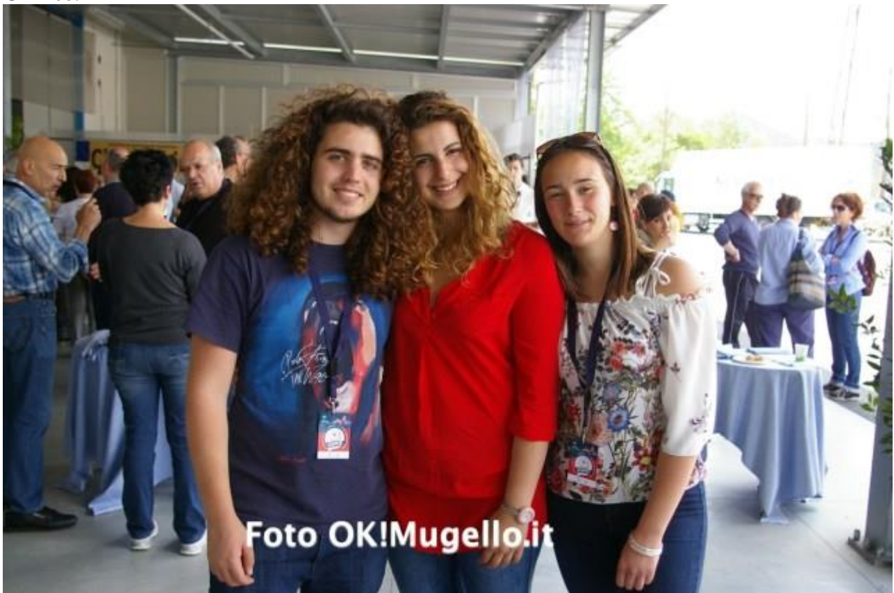
Alcuni giovani in visita alla Chi-Ma.