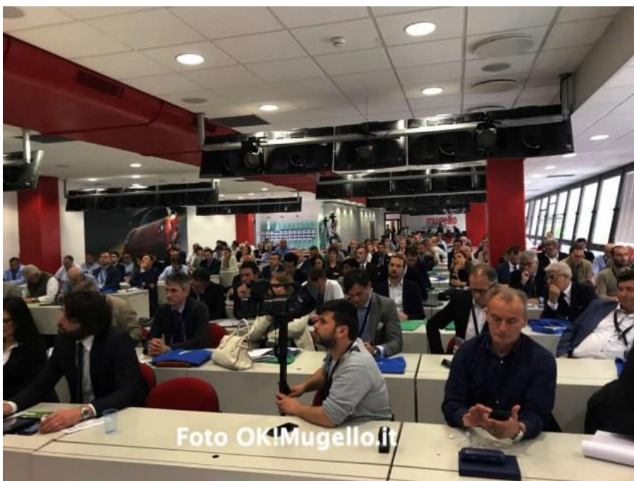
Panoramica della Sala Stampa del Mugello Circuit durante il convegno dell'Assosistema-Confindustria